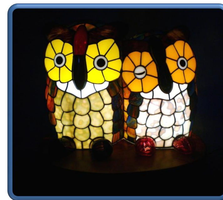
ほっこり Tadokoro Kouichi