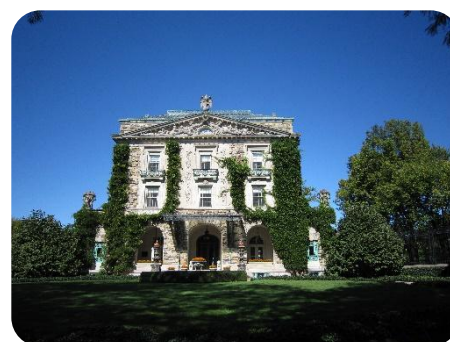
ロックフェラー邸