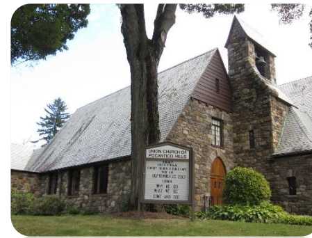
ユニオンチャーチ

ニューヨーク滞在中に時間があれば、ハドソン川沿いスリーピーホロウにあるKykuit・ロックフェラー邸を見学し、そのお膝下にあるユニオンチャーチもお勧めします。マチスのバラ窓とシャガールのステンドグラスに囲まれた静かな教会です。